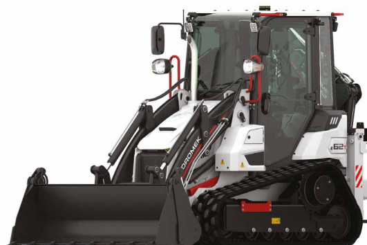
Cazo de una pieza